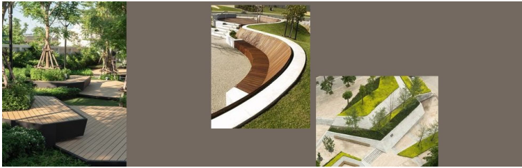
Tavola delle Funzioni Tavola delle Funzioni